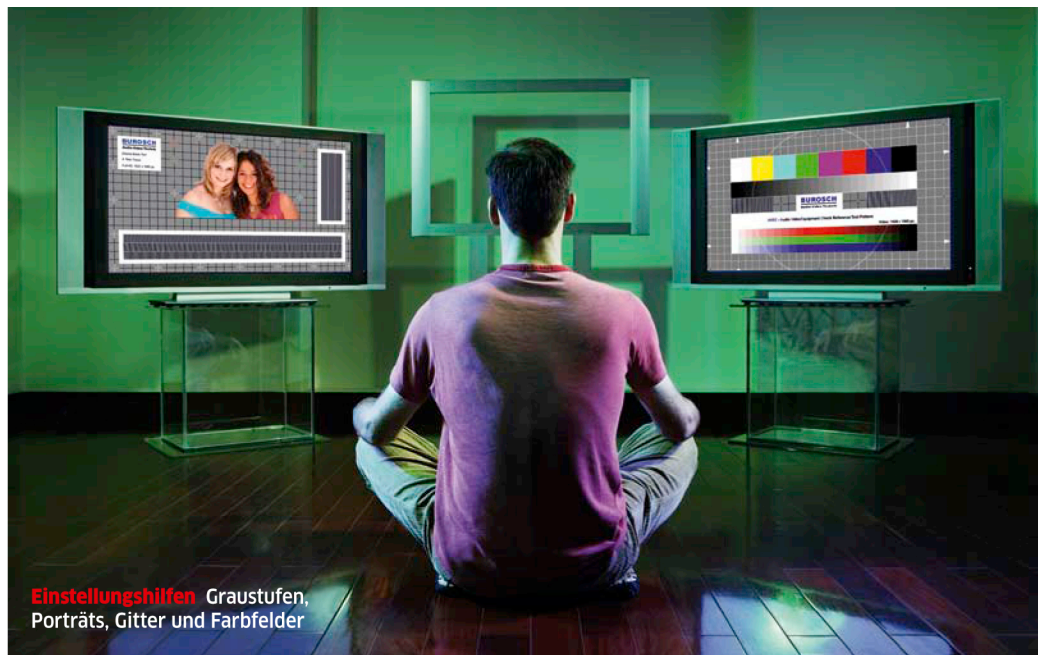
Einstellungshilfen Graustufen, Porträts, Gitter und Farbfelder

Nicht immer ist das fabrikneue LCD-TV OPTIMAL EINGESTELLT . Doch mit unseren Tipps holen Sie das Beste aus Ihrem Fernseher heraus